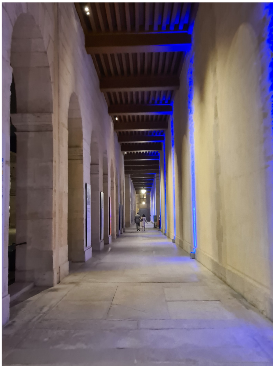
3 février 2022 – Concert du Gouverneur militaire de Paris.

Grâce à nos énergies fédérées, nous développons, autour de l'être humain, de réels savoir-être et contribuons au développement d'une culture faite d'exigence et de passion.