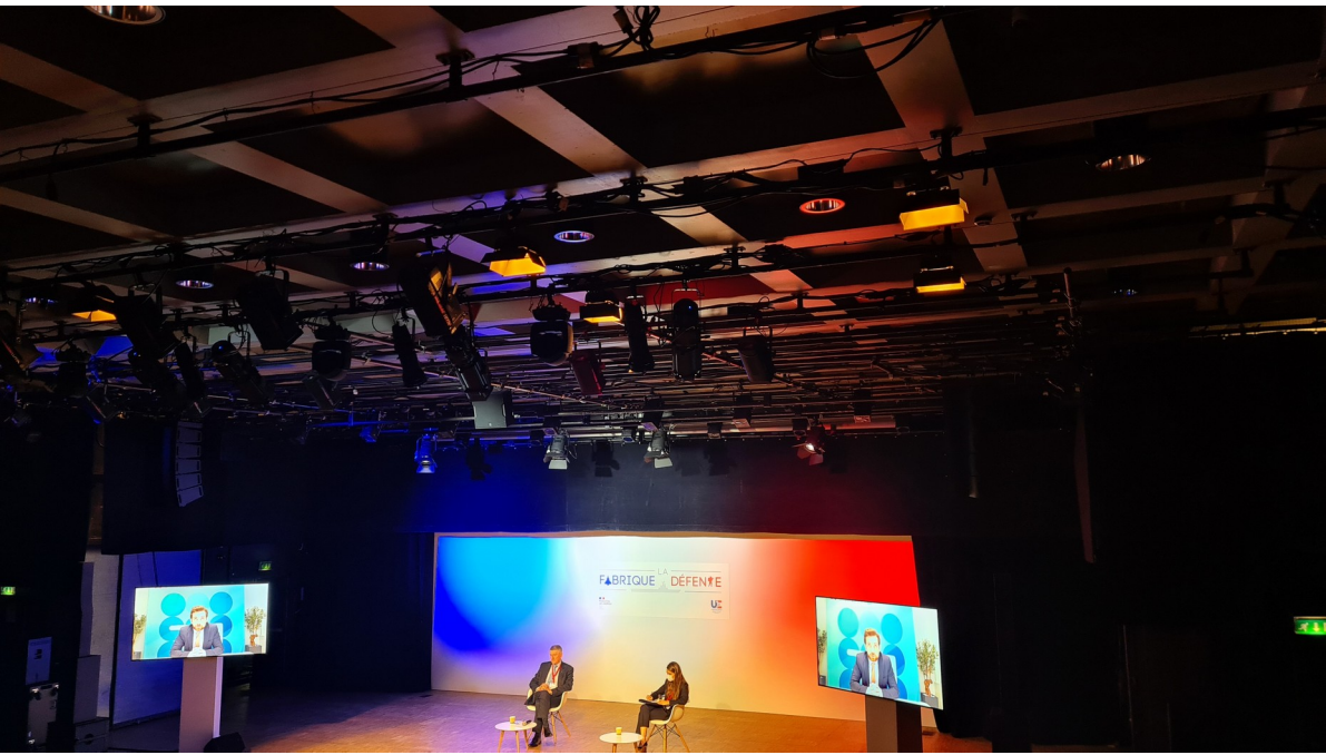
29 janvier 2022 – La fabrique Défense – Paris.