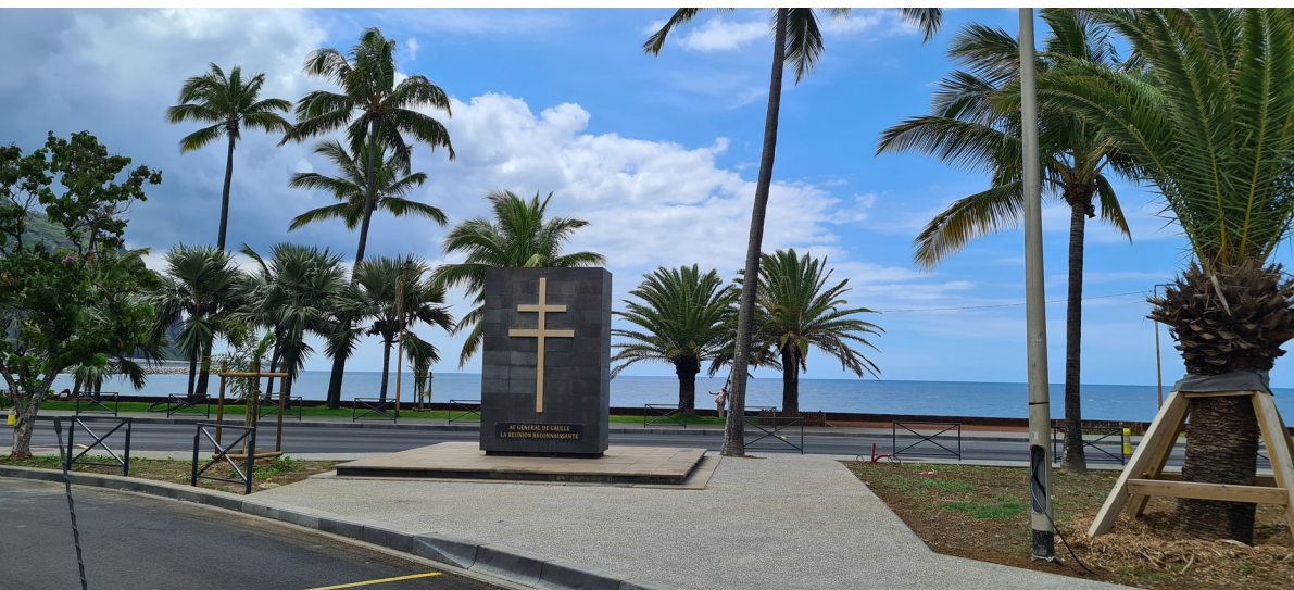
1 er janvier 2022 – Île de la Réunion.