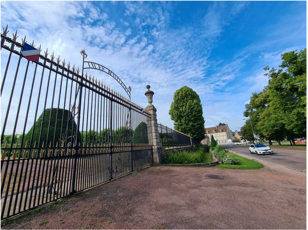
Lycée militaire – Autun – 3 juillet 2021