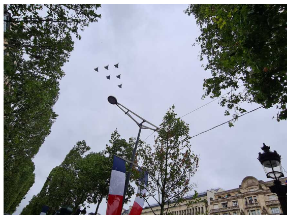
Avenue des Champs-Élysées – Paris - 14 juillet 2021