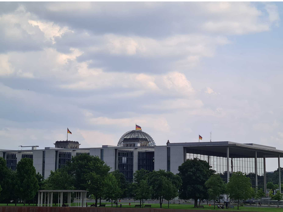
Berlin – 25 juillet 2021