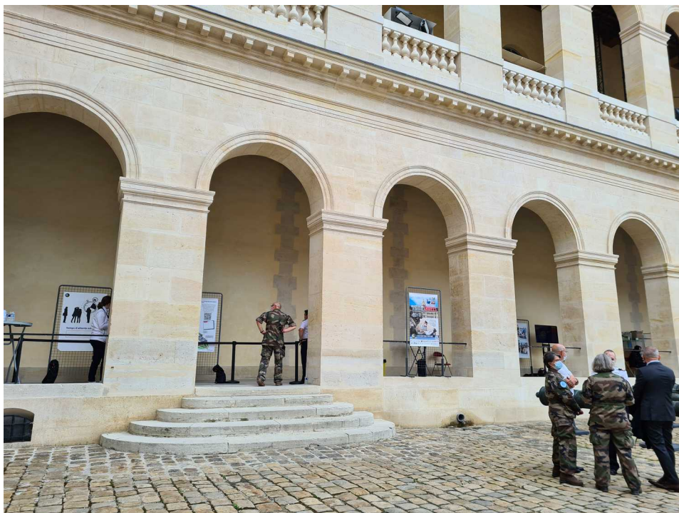
Hôtel des Invalides – Paris - 14 juillet 2021