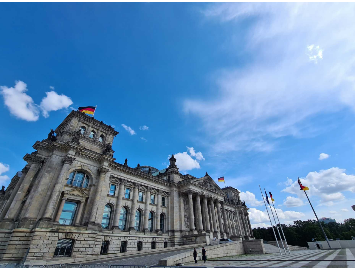
Berlin – 27 juillet 2021