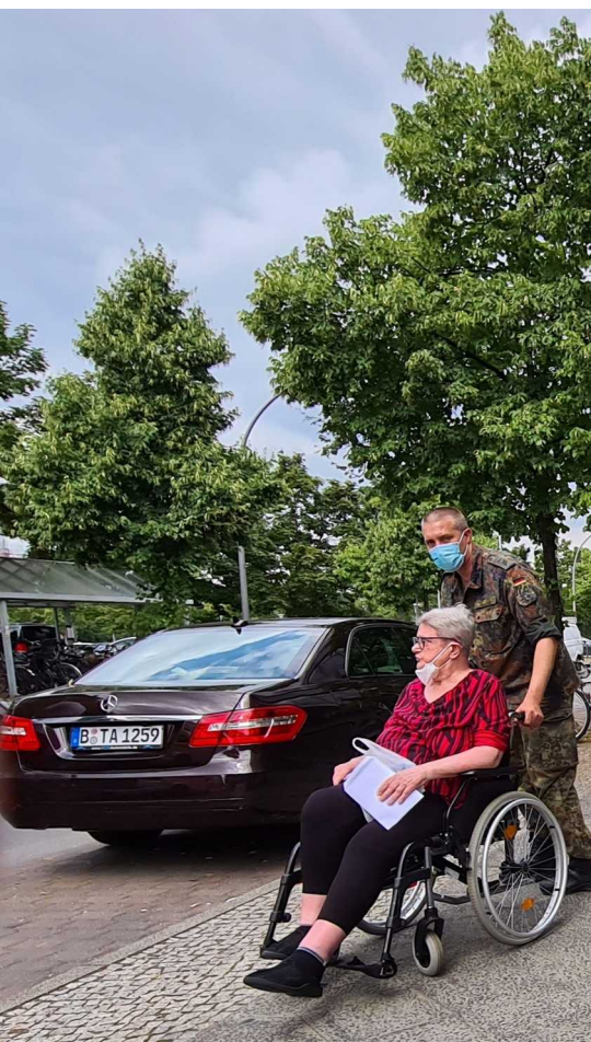
Berlin - 22 juillet 2021

Dans l'urgence, la culture de solidarité dépasse toute notion de profit, de domination, mais également de concurrence.