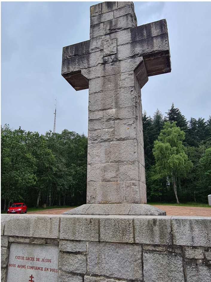
Croix de la libération – Autun – 3 juillet 2021