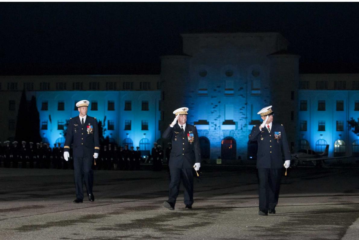
Archive 2014 – Baptême de promotion – Salon-de-Provence