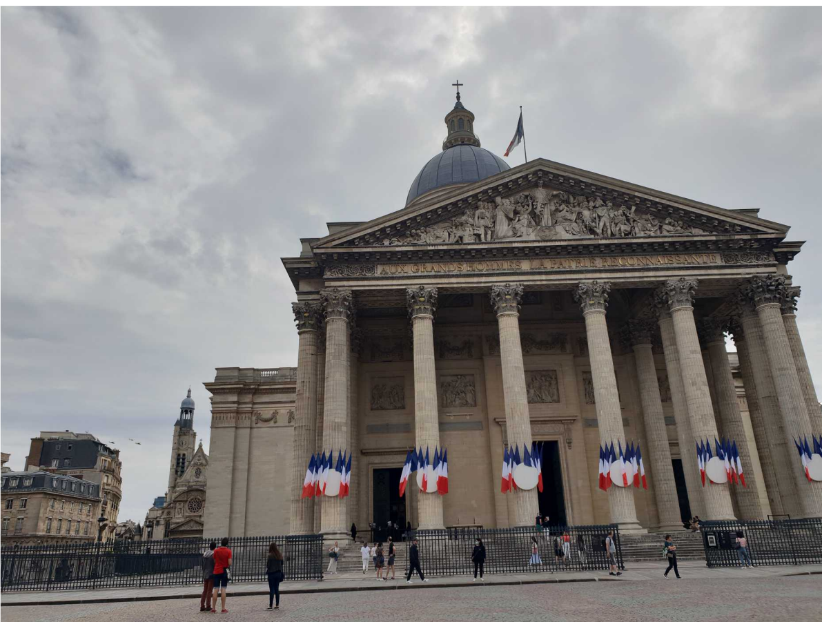
14 juillet 2020 – Défilé aérien - Paris