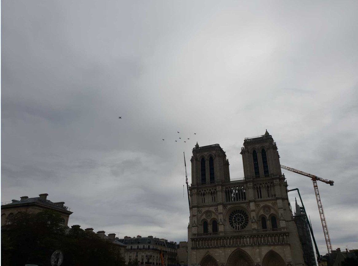
14 juillet 2020 – Notre Dame survolée par la patrouille de France