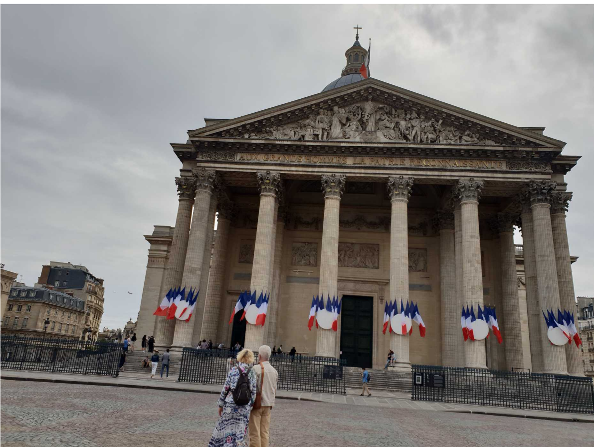
14 juillet 2020 – Défilé aérien - Paris