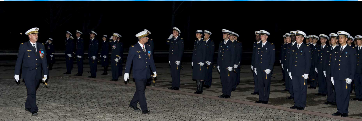
Archive 2014 – Baptême de promotion – Salon-de-Provence

Le plan de relance européen historique est donc acté. Ainsi débutera l'aventure au destin commun, aux liens indissociables.