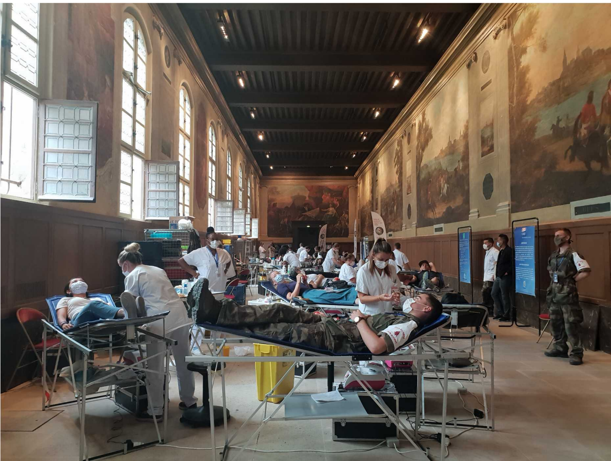
14 juillet 2020 – Musée de l'Armée - Paris